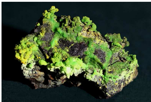
johannit (Jáchymov-Svornost, žíla Evangelista, 1982)