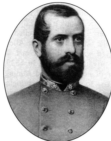
arcivévoda Johann (1782-1859)

Johannit tvoří drobné tence sloupcovité krystalky, které se někdy růžicovitě seskupují. Jejich barva je zářící, světle jablečně až smaragdově zelená, krystalky jsou křehké, průsvitné až průhledné, silně skelně lesklé. Časté jsou i kulovité agregáty, složené z droboučkových krystalků. Vyskytuje se na rozvětralých kusech žiloviny se smolincem, pyritem, chalkopyritem či bornitem a v bezprostředním okolí, nejčastěji v doprovodu sádrovce, uranopilitu a minerálů ze skupiny zippeitu, vzácně i chalkantitu (modré skalice). Ve vodě se pomalu rozpouští, v ultrafialovém světle nezáří.