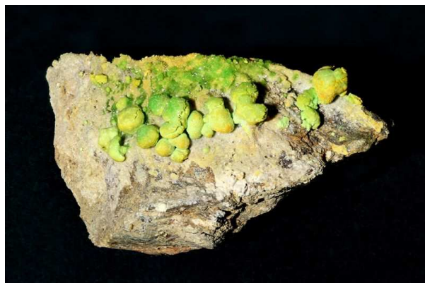
johannit (Jáchymov-Svornost, žíla Evangelista, 1977)